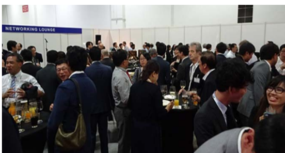
レセプション歓談風景