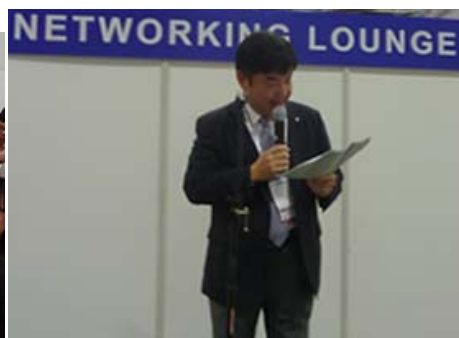
ト部海外市場開拓検討WG 座長レセプション閉会挨拶