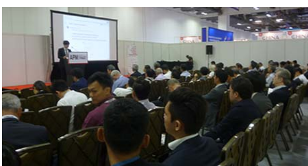
セミナー聴講の様子