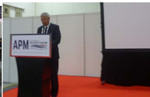
小野副会長のセミナー閉会挨拶