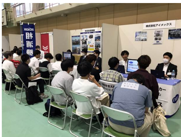
各社ブースの様子