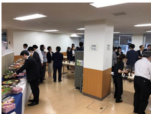
教員と会員企業による懇談会の様子