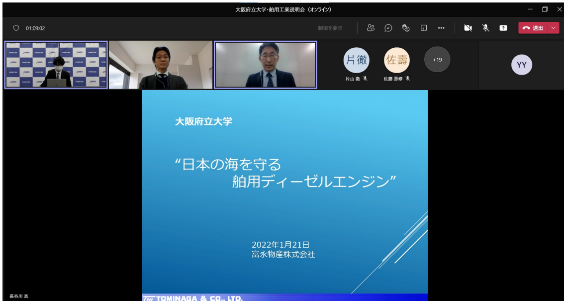
富永物産(株)による講演