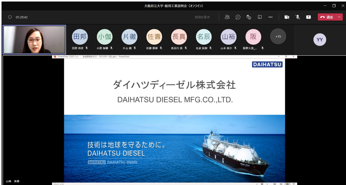
ダイハツディーゼル(株)による講演