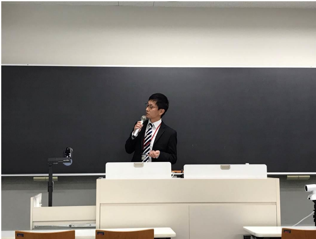
(株)ジャパンエンジンコーポレーションによる講演の様子