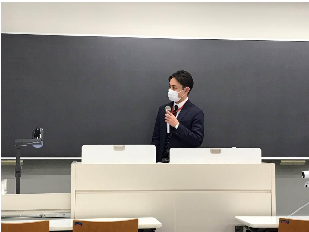
大洋電機(株)による講演の様子