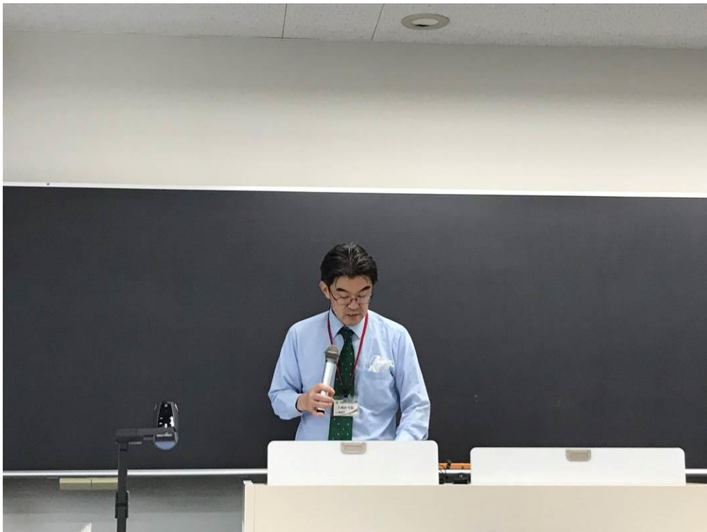
当会による講演の様子