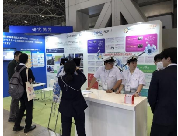
(独法) 国立高等専門学校機構