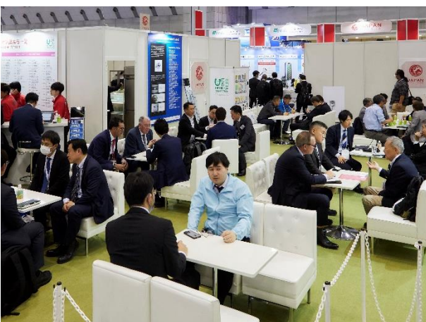
ジャパンパビリオン案内所