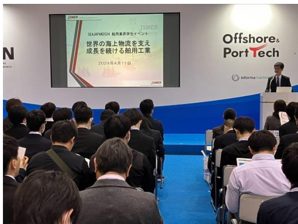
オリエンテーション及び講演