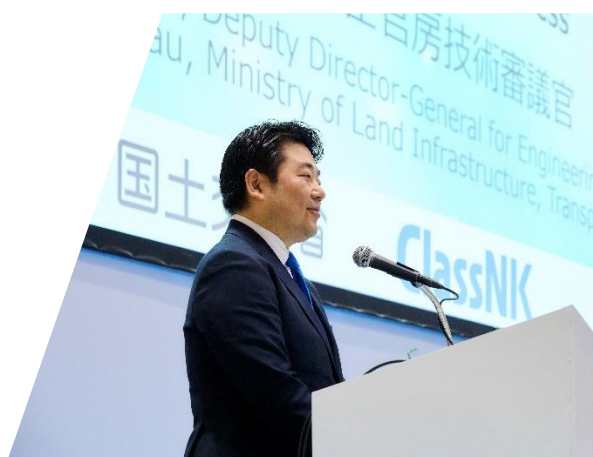
今井大臣官房技術審議官の開会挨拶