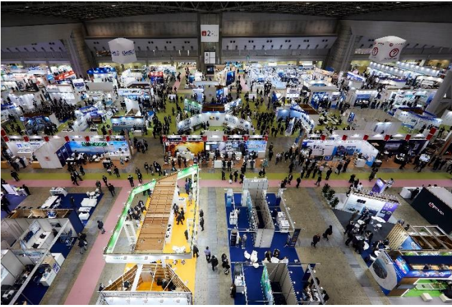
SEA JAPAN 会場の様子