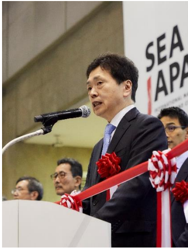
水嶋智国土交通審議官の開会挨拶