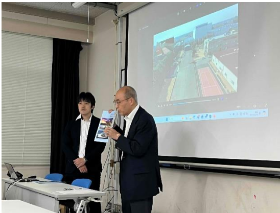
カシワテックによる講演