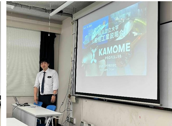
かもめプロペラによる講演