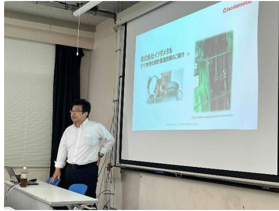
イソダメタルによる講演